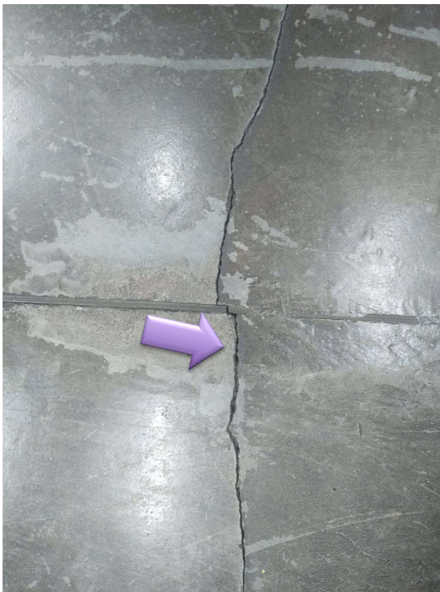
Imagem 5: A exemplo de USP. observar o fotografada.

As imagens 5 e 6 a seguir ilustram trincas, fissuras e desgaste da resina do piso de cimento queimado.