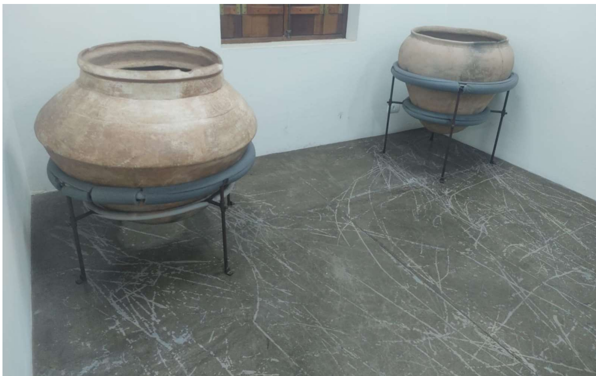
Imagem 4: A imagem mostra 2 urnas funerárias que serão previamente retiradas pela equipe da curadoria do MAE. Observa-se também o desgaste da resina no piso da sala expositiva.