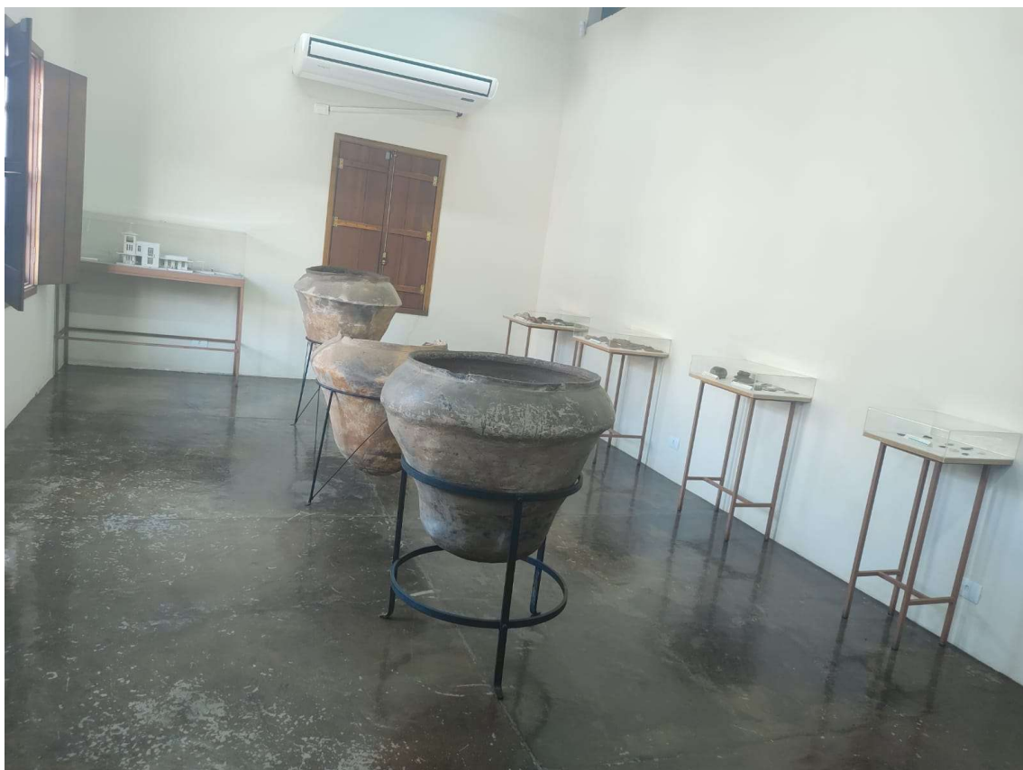
Imagem 2: A imagem mostra urnas funerárias e estantes expositivas que serão retiradas da sala pela equipe da curadoria do MAE, previamente ao serviço de reparo do piso. Na imagem também é possível observar o desgaste da resina no piso da sala expositiva.